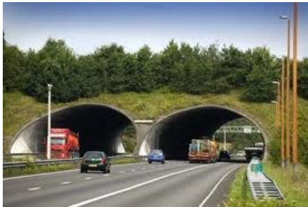
A50 ecoduct Woeste Hoeve , rijkswaterstaat.nl

Hoeveel geld hiermee is gemoeid wil Talsma niet verklappen, maar dat het gaat om een aanzienlijk bedrag is duidelijk.